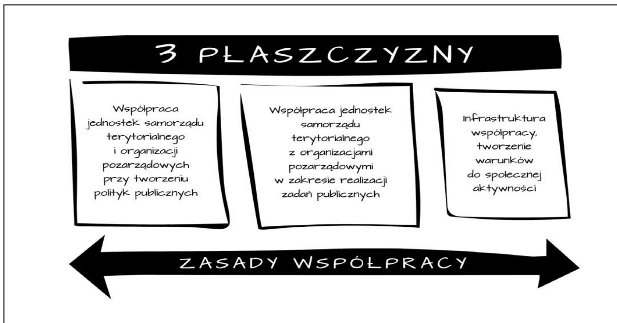
Rysunek 2. Płaszczyzny współpracy międzysektorowej

Nad modelem współpracy międzyresortowej zastanawia się wiele podmiotów, którym zależy na umacnianiu więzi społecznych, budowaniu poczucia odpowiedzialności za swoje otoczenie oraz zaspokajaniu potrzeb różnych grup społeczności lokalnej. Utworzony w 2003r. Departament Pożytku Publicznego w Ministerstwie Pracy i Polityki Społecznej odpowiada za tworzenie warunków dla rozwoju organizacji pozarządowych i innych podmiotów prowadzących działalność pożytku publicznego, dla rozwoju wolontariatu, a także dla współpracy administracji publicznej z trzecim sektorem. W partnerstwie z Fundacją Instytut Spraw Publicznych (ISP) w ramach projektu „Model współpracy administracji publicznej i organizacji pozarządowych – wypracowanie i upowszechnienie standardów współpracy”, realizowanego w ramach Priorytetu V Dobre rządzenie, Działanie 5.4 Rozwój potencjału trzeciego sektora, Poddziałanie 5.4.1 Wsparcie systemowe dla trzeciego sektora Programu Operacyjnego Kapitał Ludzki został wypracowany Poradnik modelowej współpracy administracji publicznej i organizacji pozarządowych, który przedstawia 3 płaszczyzny współpracy administracji publicznej i organizacji pozarządowych.