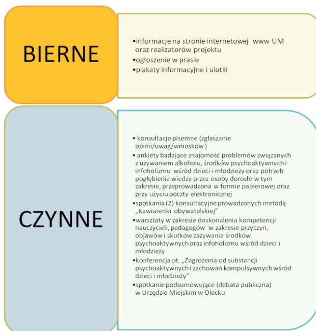
Rysunek 2. opracowanie własne

Nad realizacją konsultacji społecznych czuwał Pełnomocnik ds. przeciwdziałania uzależnieniom przy współudziale członków Gminnej Komisji Rozwiązywania Problemów Alkoholowych.